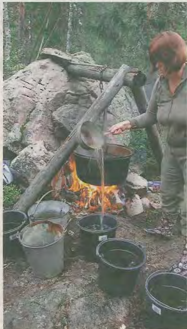
Tempererat. Vattnet måste hålla rätt temperatur och därför blandas det heta vattnet från kitteln med kallvatten.