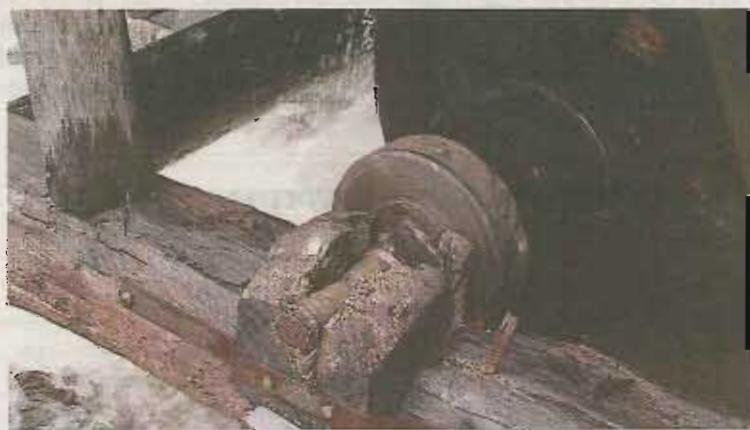
Gammalt och hållbart. Vevaxeln till vattenhjulet vilar i en "knota" från en tall. Och den håller fortfarande.