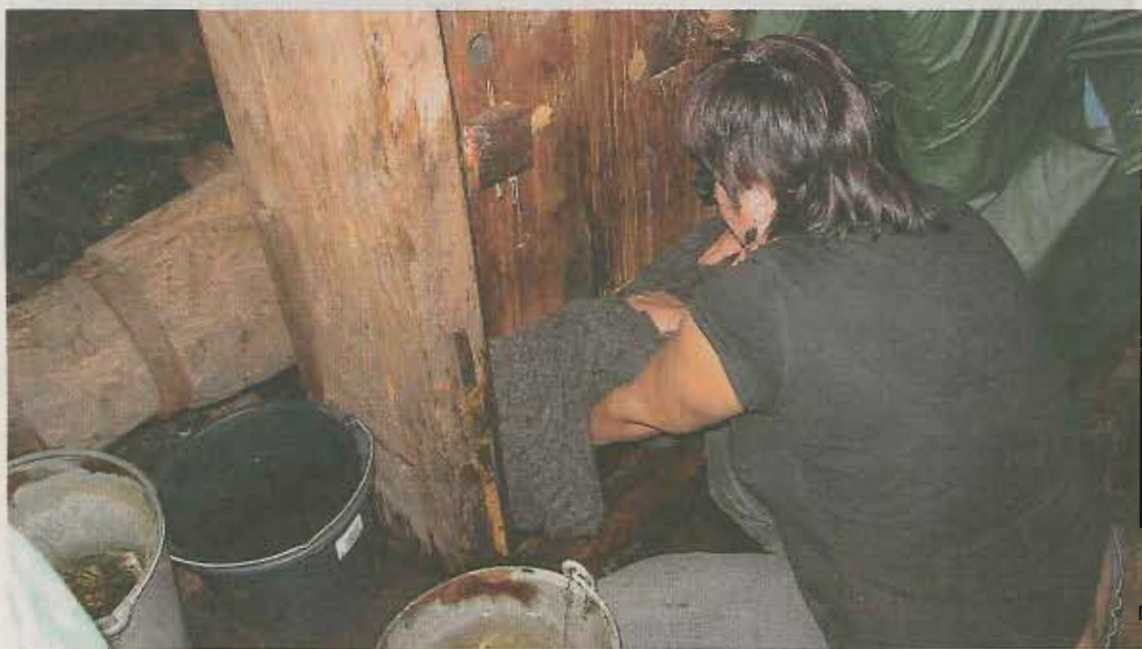
Stoppar i. Det vikta tyget stoppas ner i stampen.